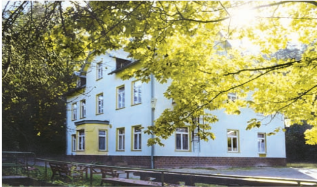
Haus Talmühle (Cursdorf)