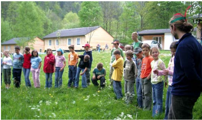
Natur-Erlebnis-Zentrum Sommitztal (Leutenberg)